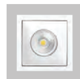
MR CUTE R FRAME white - AX.MRC.F.W