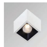
FRONT RING black AX.FRG.B