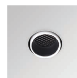
HONEYCOMB 35 AX.HCB.35.B