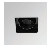
HONEYCOMB 50 AX.HCB.50.B